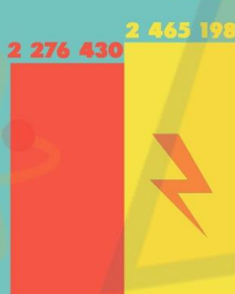
ДЖЕРЕЛА ПОСТАЧАННЯ ЕНЕРГІЇ ТА ЇЇ ПОТУЖНІСТЬ У 2017 РОЦІ У ЛУГАНСЬКІЙ ОБЛАСТІ (ПРОМИСЛОВІСТЬ)