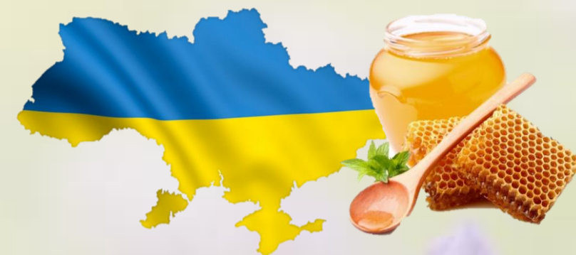
Обсяги виробництва меду (тон)

Бажаємо взаєморозуміння зі своїми працюючими бджілками, найсмачнішого меду і незліченних солодких моментів в житті! Хай праця на пасіці радує високими результатами, щедрим медовим врожаєм і веселим дзижчанням, приємним для душі і серця!